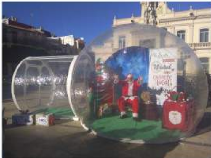
Papá Noel visitó el Sambori del Nadal para recoger las cartas de los más pequeños y apoyar al comercio local.

La Marxa del Nadal ha logrado recaudar más de 200 kg de alimentos no perecederos, que se han donado a Càritas; los participantes obtienen su dorsal solidario a cambio de la donación de al menos un kilo de estos alimentos. Con su dorsal, pudieron disfrutar de una merienda navideña y participar en un gran sorteo de regalos patrocinados por destacados comerciantes locales.