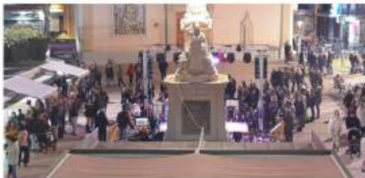
La VI Fira del Comerç i de la Tapa es va celebrar els dies 15, 16 i 17 de novembre en la Plaça de l'Ajuntament.

La gran festa anual del comerç local ha comptat amb totes les tipologies comercials d'Alfara