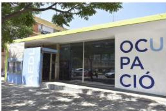
La ADL se situa en la Plaza Cortes Valencianas, en el Barrio de San Jorge.

Con su incorporación, la ADL suma un nuevo valor añadido para planificar acciones estratégicas en las áreas de empleo, formación, comercio y emprendimiento. En este sentido, la ADL mejora sus servicios de asesoramiento en materia de empleo y formación, así como otras intervenciones para la promoción económica y la dinamización del tejido empresarial de Alfafar.