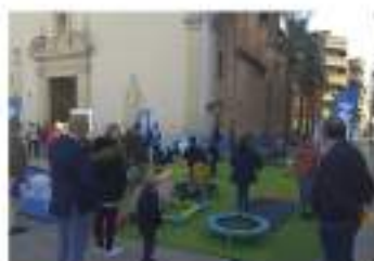
El rebre va comptar amb nombrosos atractius infantils i activitats culturals.