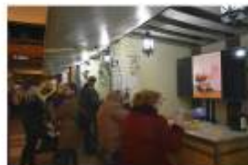
Veïns i visitants van gaudir de la variada oferta gastronòmica de proximitat local.