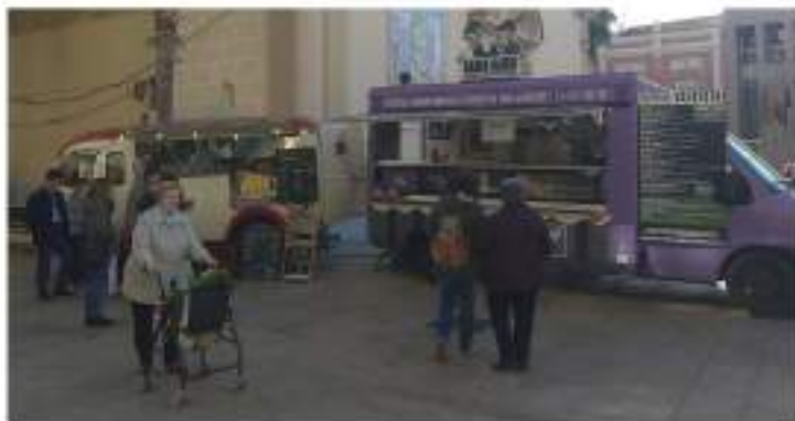
El nou Paraeta Fest va comptar amb la visita de caravanes food truck.