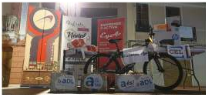
Destacados comercios locales patrocinaron el gran sorteo de regalos de la primera Marxa del Nadal.